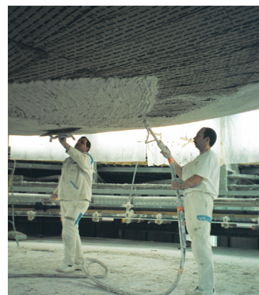
projection du plâtre sur le STUCANET®